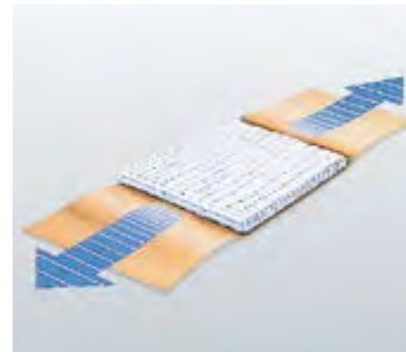
Kein Verkleben mit der Wunde.

Nur die Peelpackungen der Hansaplast® Elastic Fingerkuppenpflaster enthalten Naturkautschuklatex, wodurch Allergien ausgelöst werden können.