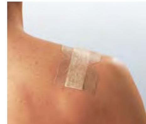
Kein Verkleben mit der Wunde.

Nur die Peelpackungen der Hansaplast® Soft Strips enthalten Naturkautschuklatex, wodurch Allergien ausgelöst werden können.